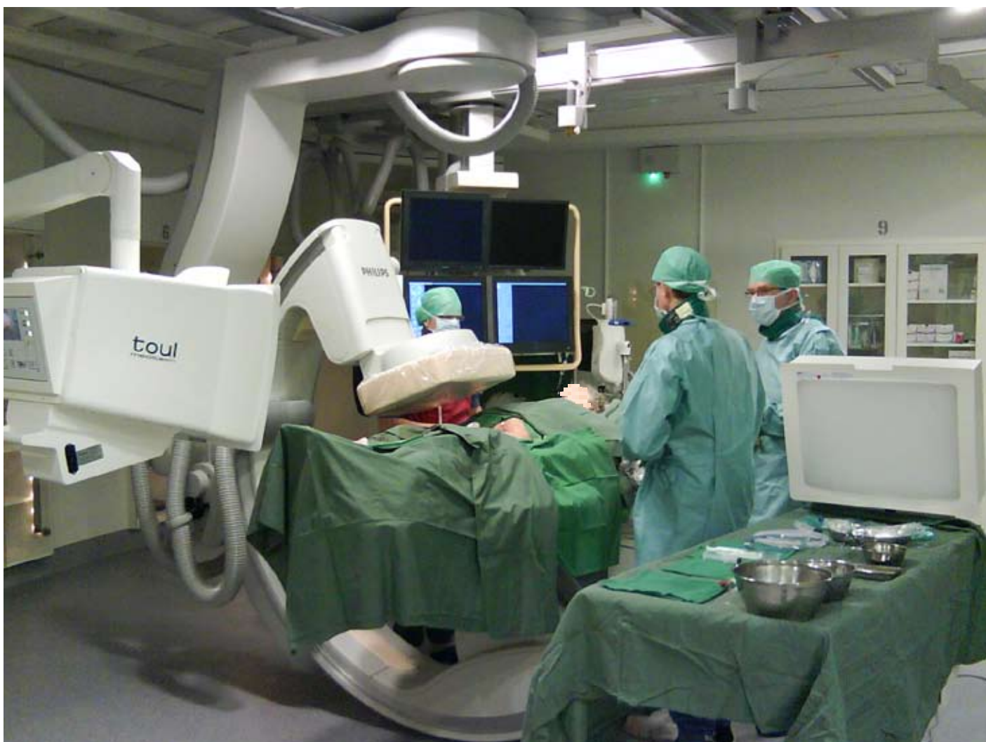
Länssjukhuset i Kalmar, Radiologiska kliniken, Angiografi med takmonterad Toul 200 samt Toul 300 Instrumentbord.